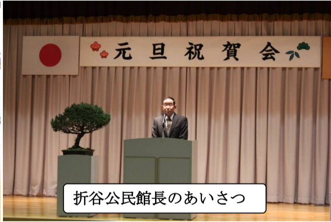
折谷公民館長のあいさつ