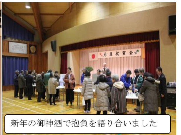
新年の御神酒で抱負を語り合いました