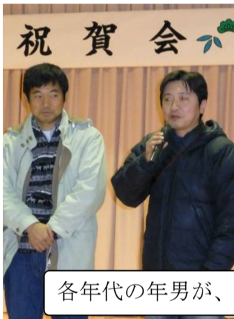
各年代の年男が、決意を述べました