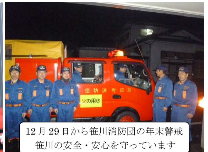
12月29日から笹川消防団の年末警戒 笹川の安全・安心を守っています