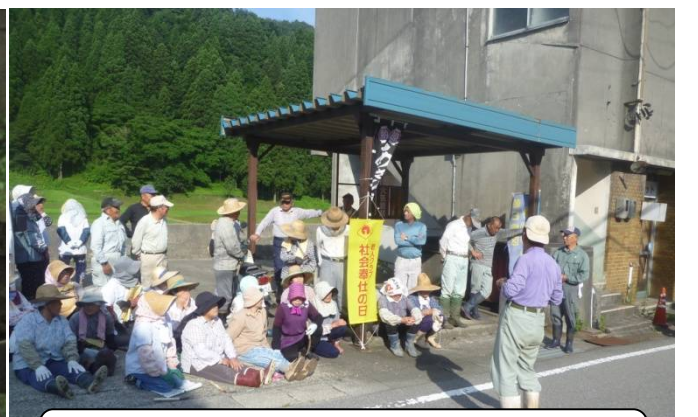
7月29日 友愛会は「社会奉仕の日」に笹川路を綺麗に清掃されました。