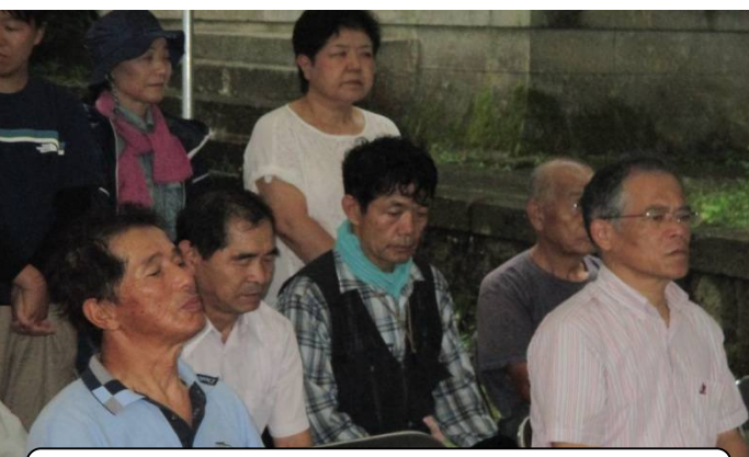
7月27日 諏訪山の山道開きと安全祈願が鹿熊県議を迎えて行われました。