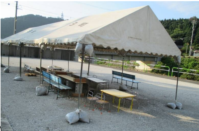
7月20日 プール跡地の整地工事が完了し、簡易なバーベキュー設備をしました。気軽にご利用下さい。連絡は陶芸センターへ