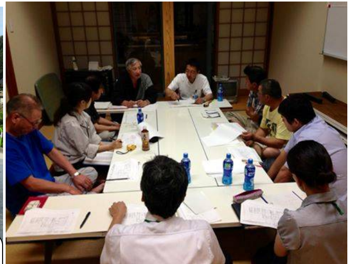
7月22日 体験交流施設の古民家改造の最終案が町と設計師から説明がありました。