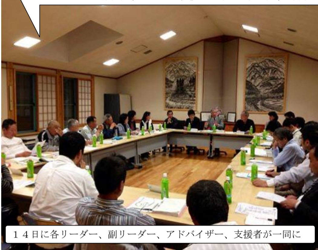
14日に各リーダー、副リーダー、アドバイザー、支援者が一同に

これまでの活動経過と今後の取り組み、活性化策を積極的に発表。8月22日には全体交流会