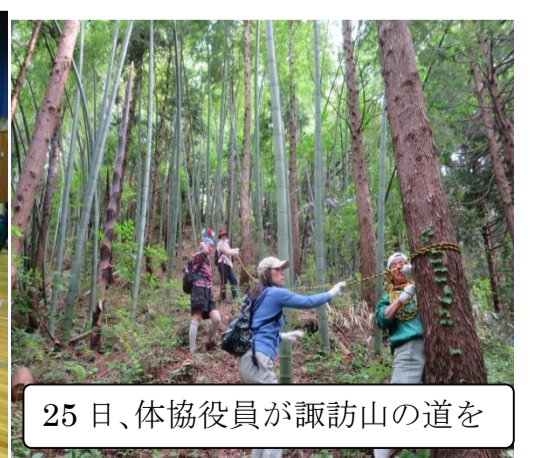
25日、体協役員が諏訪山の道を

【編集後記】チーム「かがやき」は、役場の協力も得て、専門知識のアドバイザーも決まり、初めて全体会議を開催し具体的な活動を開始しました。また、各種団体等も様々な取り組みをして、地区全体の活性化の底上げをしております。「楽しく・仲良く」をモットーに住みたい里の活動にしたいものです。 ※皆さんからの要望が叶い、ささ郷に自販機が設置されました。