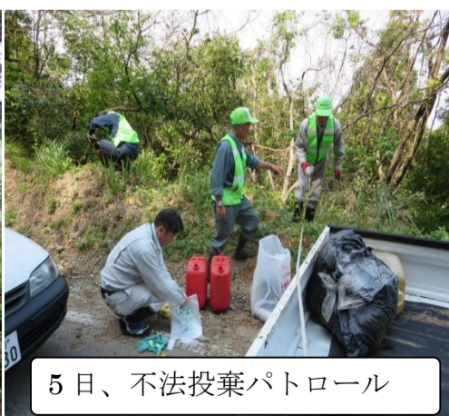
5日、不法投棄パトロール