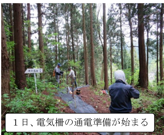
1日、電気柵の通电準備が始まる