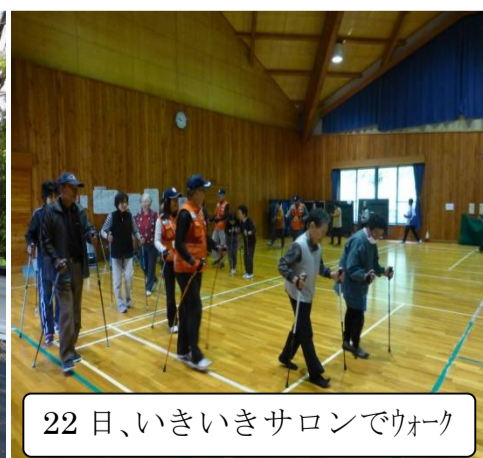
22日、いきいきサロンでウォーク