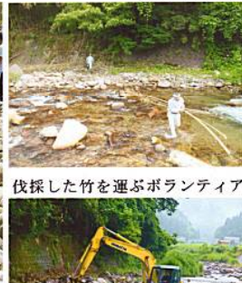
伐採した竹を運ぶボランティア